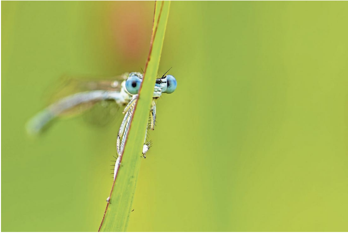
Es werden Einzel- und Gruppenarbeiten präsentiert, wie dieses Bild von der abgebildeten Kleinlibelle.

Elf Mitglieder des Fotoclubs präsentieren zehn Einzelarbeiten und eine Gruppenarbeit. Die Beiträge reflektieren die Vielfalt der fotografischen Herangehensweisen der Mitglieder und umfassen eine Reihe von Themen. Es gibt verschiedene Welten zwischen heimischen Naturwundern, traditionellem Handwerk und der historischen Entwicklung einer Tourismusdestination zu entdecken. Weitere Themen sind ein Spaziergang durch Eschen-Nendeln, ein schlammiger Hindernislauf und ein Singer-Songwriter-