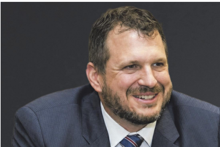
Gesundheit im Fokus bei den 6. Wissenschaftsgesprächen Triesen.

Seit 2010 leisten über 2000 zu Studienbeginn junge gesunde Erwachsene einen wichtigen Beitrag zur Erforschung von Risikofaktoren für Bluthochdruck und Herz-Kreislauf-Erkrankungen. Interessierte erhalten Einblicke in Studiendesign, zentrale Erkenntnisse und die Bedeutung dieser einzigartigen Langzeitstudie. Am Donnerstag, 23. April um 17 Uhr sind alle Interessierten eingeladen, in den Ge-