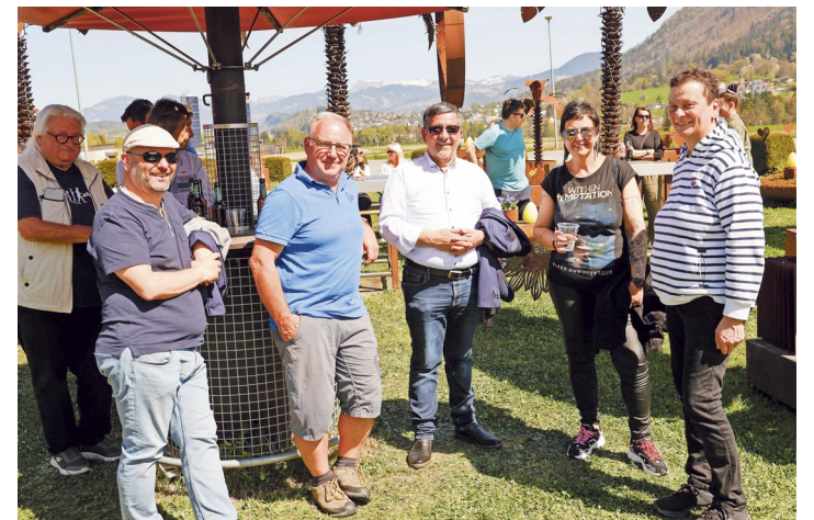
Morgen lädt die Gewerbeausstellung «Mauren attraktiv» zu einem besonderen Erlebnis ein.

«Mauren attraktiv» bietet damit nicht nur Einblicke in das